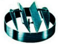
REGULACION A TORNILLO 100%